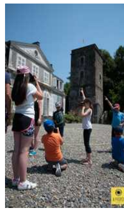
© Philippe Glorieux // à propos

À travers ce média, qui est transversal, nous pouvons proposer un large champ d'activités qui peut aller de l'étude du cycle de la vie, de la découverte de la très petite faune et de la flore (et donc de son respect) pour les maternelles et le premier cycle, avec la macrophotographie, à la sensibilisation de la diffusion des informations et de développement du regard citoyen avec le photojournalisme. Le reportage, le portrait photographique développeront la curiosité et l'empathie, tandis que la photographie d'architecture replacera la question de l'humain dans son patrimoine et son territoire. Le style roman-photo développera l'imagination et la rédaction d'un scénario.