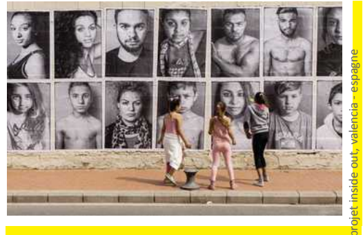
projet inside out, valencia - espagne