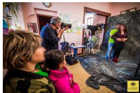
© Pierre-Antoine Lalande // à propos

La photographie est aussi, un fabuleux outil au service de l'estime de soi et de leur légitimité citoyenne, de l'émancipation et de l'autonomie de la personne. Comme au travers du portrait photographique, l'association propose par exemple, des séances de prise de vue studio avec un tirage d'art offert d'un portrait de famille ou individuel auprès des bénéficiaires des Restos du Cœur. Elle proposera, très prochainement si les financements le lui permettront, cette prestation aux bénéficiaires d'autres associations caritatives, aux EHPAD, à La Maison des Sourds pour renforcer les liens familiaux et intergénérationnels entre les résidents, les bénéficiaires et les familles. L'association a aussi pour vocation d'accompagner les populations en difficulté avec des ateliers comme cités ci-dessus, mais aussi en proposant de s'attacher à leurs histoires et de témoigner au travers de reportages ou de portraits leurs conditions de vie pour une meilleure compréhension partagée.