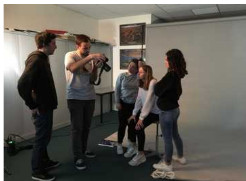
© Marie-Laure Ponsolle // à propos