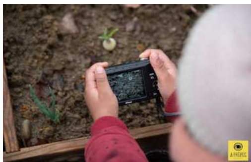
© Philippe Glorieux // à propos