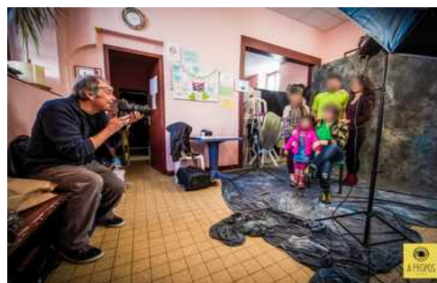
© Pierre-Antoine Lalande // à propos

Variante : Les portraits peuvent se faire en extérieur, intégrant par exemple l'environnement d'un quartier ou d'une zone rurale – La remise des photos (restitution) peut se faire en différé, par la structure accueillante.