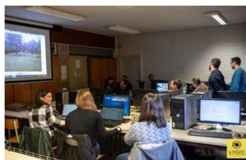
© Philippe Glorieux // à propos