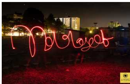
© Philippe Glorieux // à propos

Ces personnes souffrent souvent d'isolement, la photographie peut-être, aussi, un fabuleux outil artistique de réunion familiale au travers du portrait de famille. L'association propose par exemple, des séances de prise de vue avec un studio mobile sur place où les familles seraient invitées à poser avec leurs proches, l'association offrirait un tirage d'art du portrait de famille ou individuel.