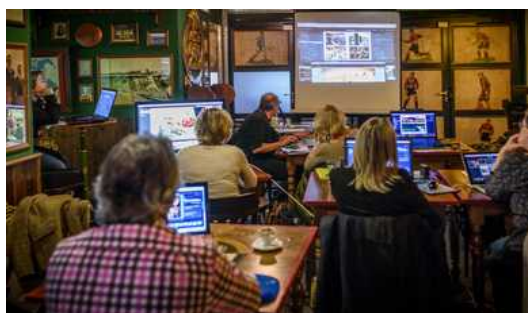
© Philippe Glorieux // à propos